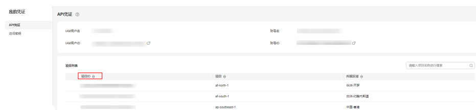
图 7-1 查看项目 ID