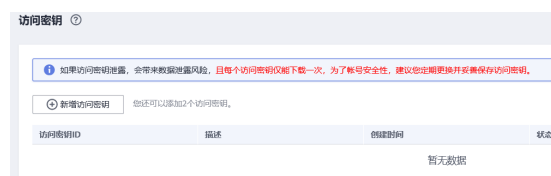
图 3-2 单击新增访问密钥