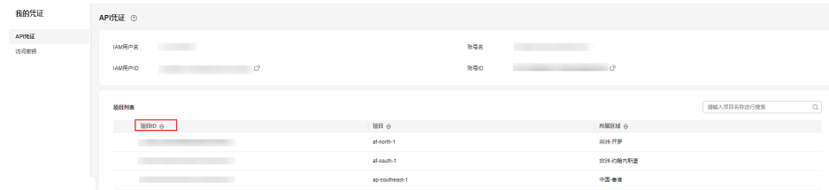
图 6-1 查看项目 ID