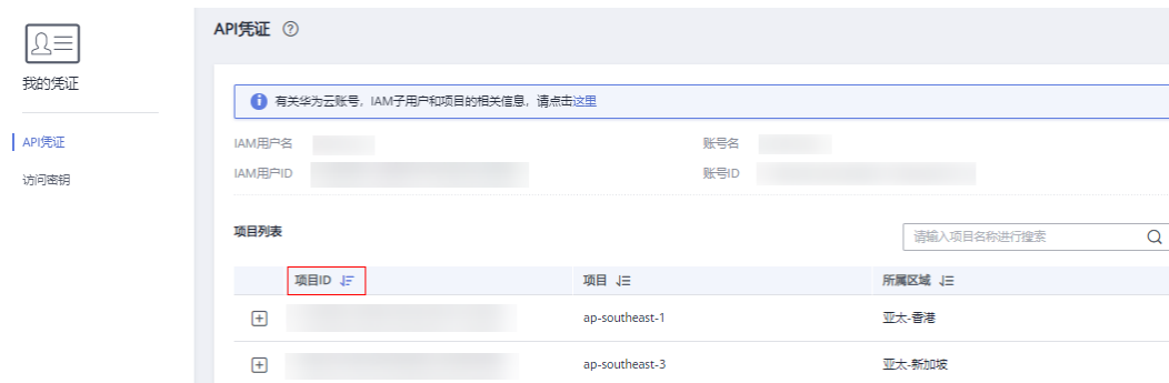
图 7-1 查看项目 ID