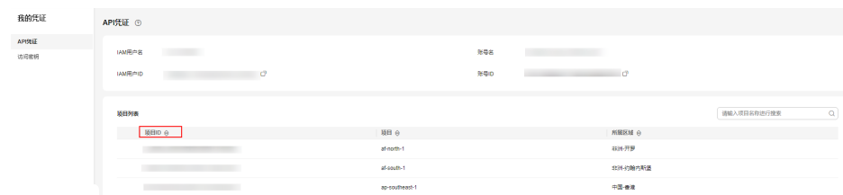
图 6-1 查看项目 ID