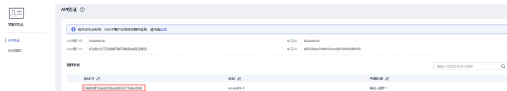
图 6-1 查看项目 ID