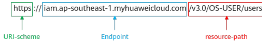
图 3-1 URI 示意图

https://iam.ap-southeast-1.myhuaweicloud.com/v3.0/OS-USER/users