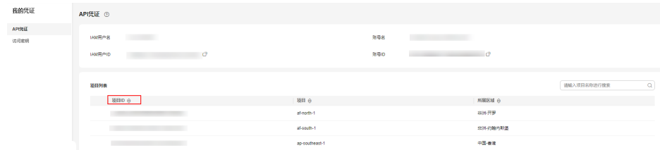
图 A-1 查看项目 ID