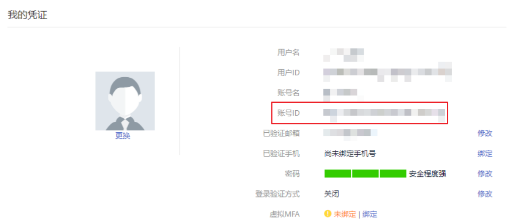
图 A-2 获取账号 ID