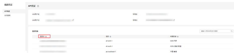
图 3-3 查看项目 ID