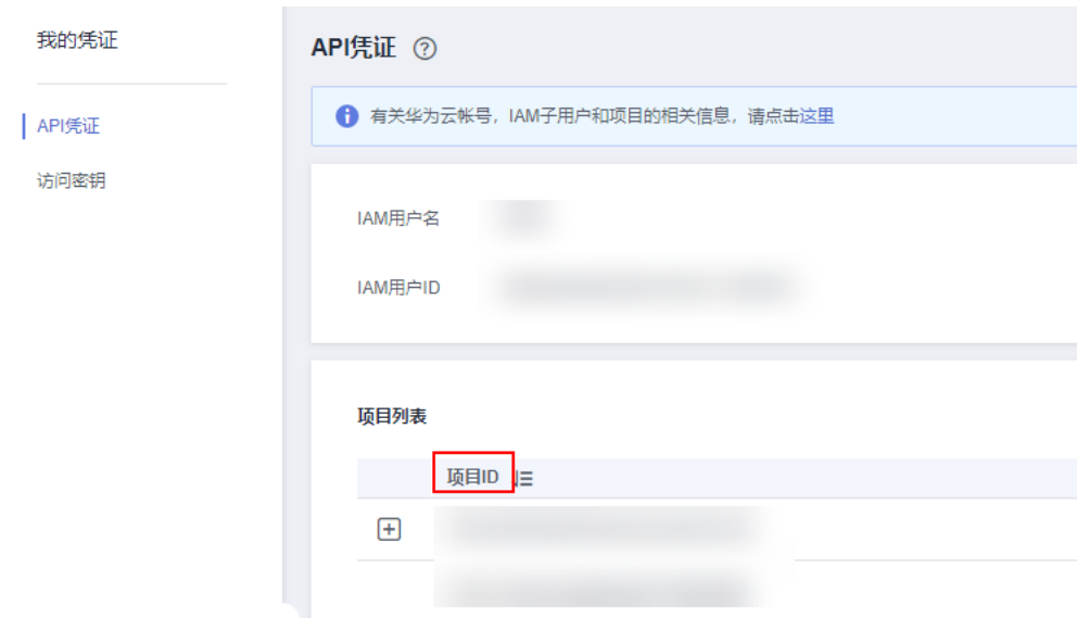
图 5-1 查看项目 ID