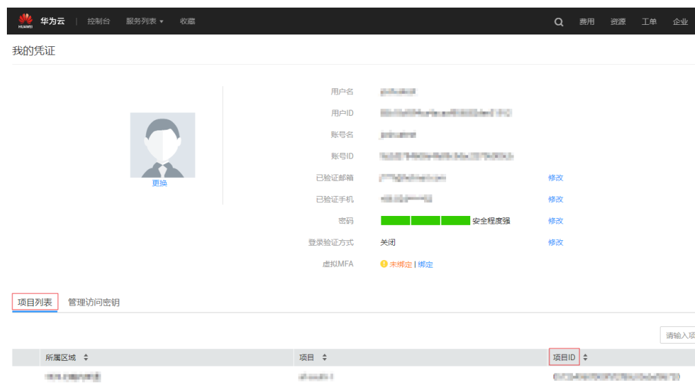
图 A-1 查看项目 ID