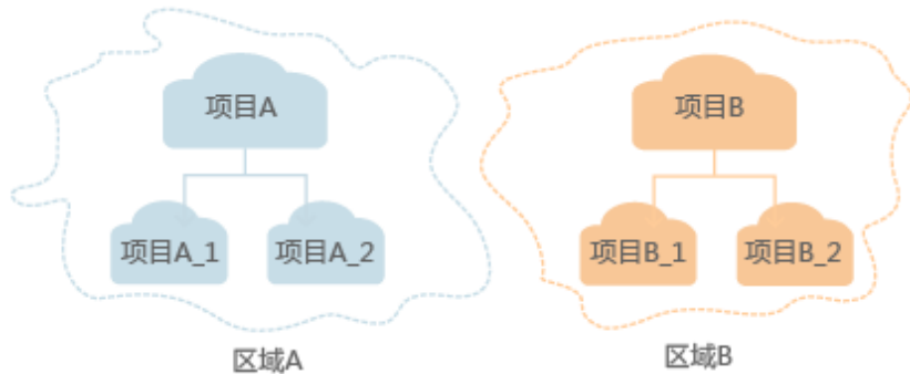
图 1-1 项目隔离模型