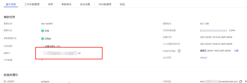
图 7-1 查看集群 ID