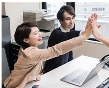
Other competitors: video at 50% packet loss

Não são necessárias redes dedicadas. O Huawei Cloud Meeting é altamente adaptável. Ele pode ajustar dinamicamente a qualidade de áudio e vídeo para corresponder à largura de banda disponível. Uma experiência de vídeo HD é assegurada mesmo com uma taxa de perda de pacotes tão alta quanto 50%.