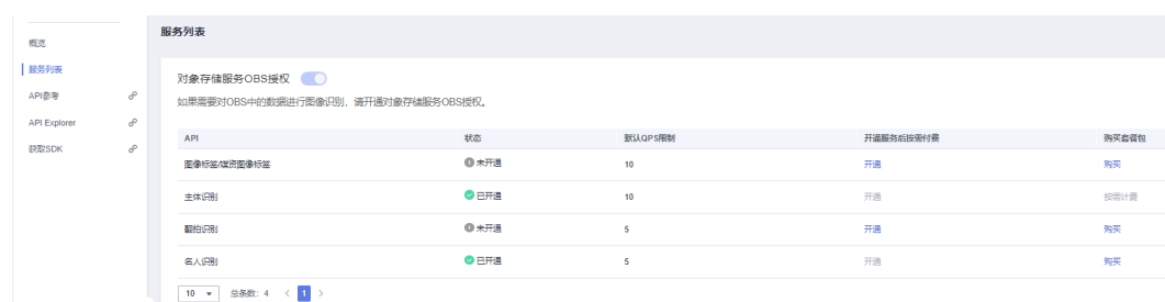
图 1-1 已开通服务

服务开通后，已申请的服务可在图像识别服务控制台的“服务列表”页面内查看，如不想再使用本服务，无需关闭，不调用即可。