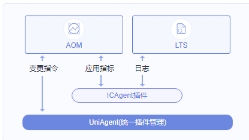
图 10-1 ICAgent 和 UniAgent 概述图