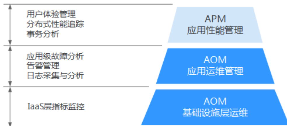
图 11-1 立体化运维解决方案