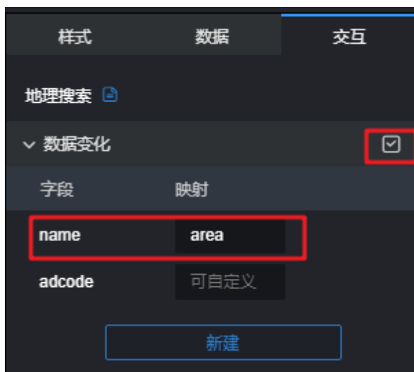
图 8-1 配置字段映射（示例）

那么就可以在其他组件中将name当做变量输入，格式为 ${name} ，如 图8-2 所示：