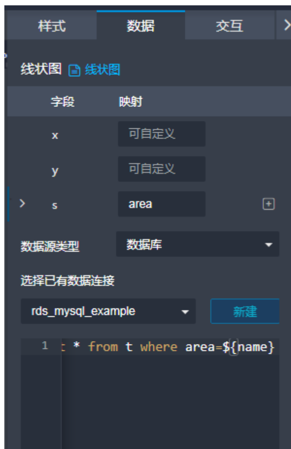
图 8-2 引用参数 (示例)