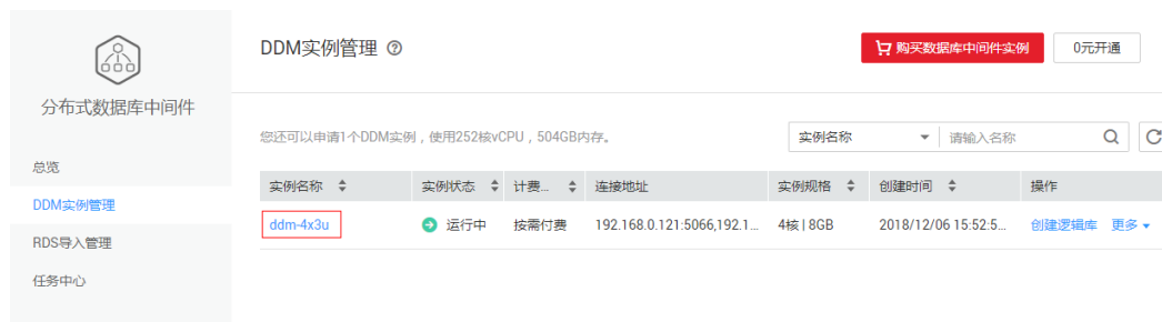
图 11-1 DDM 实例管理