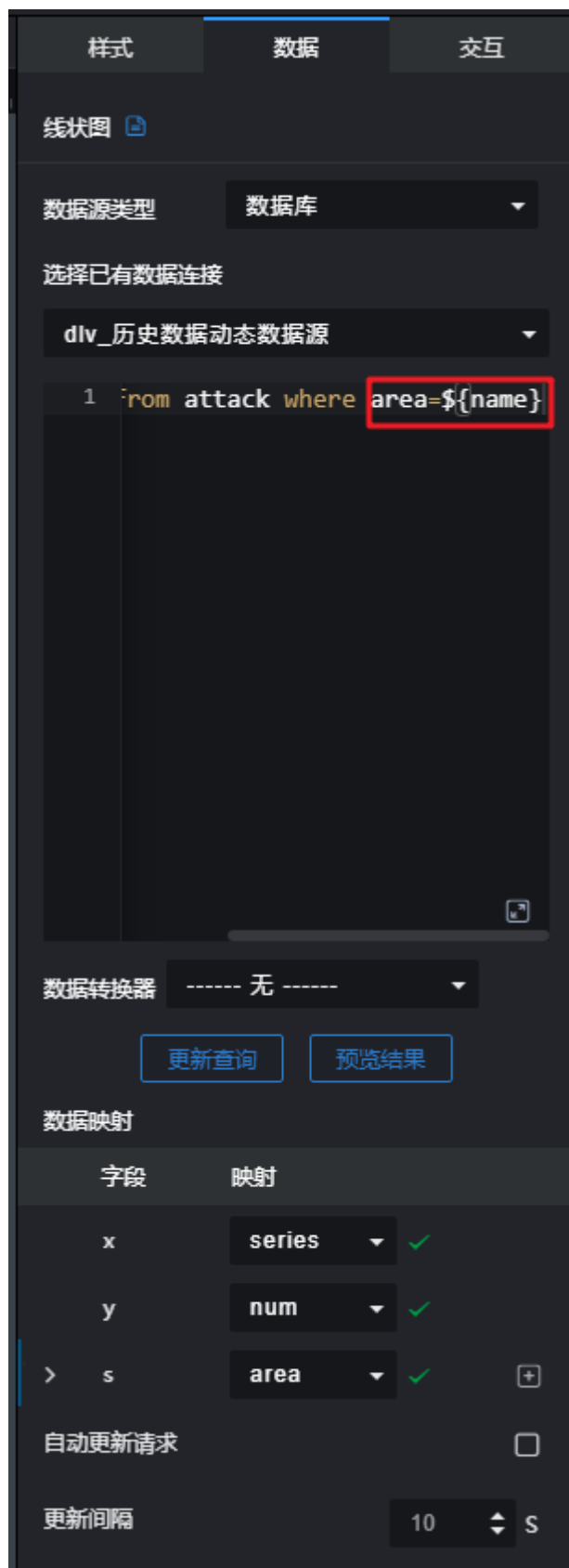
图 8-2 引用参数 (示例)