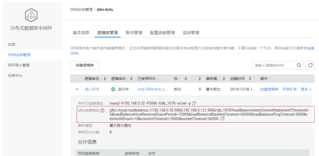
图 11-2 DDM 实例详情