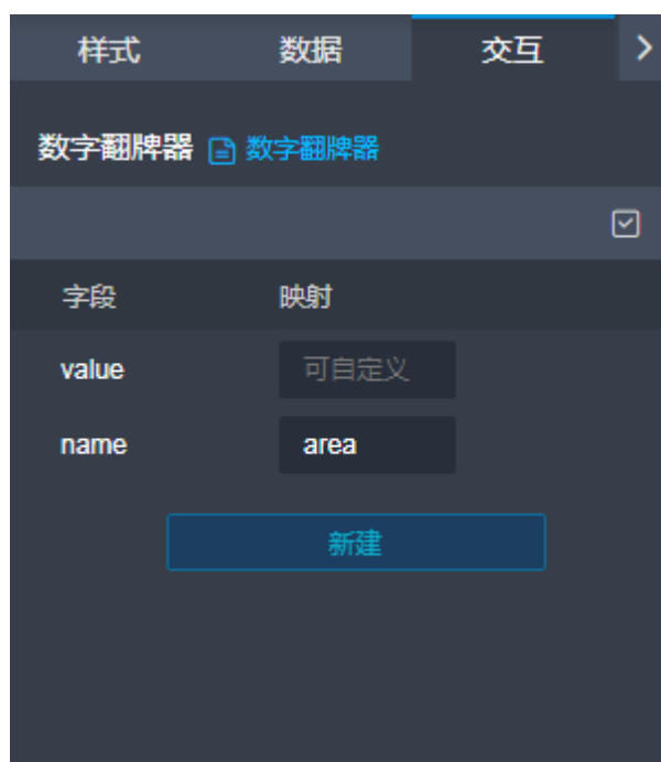
图 8-1 配置字段映射（示例）

那么就可以在其他组件中将name当做变量输入，格式为 ${name} ，如 图8-2 所示：