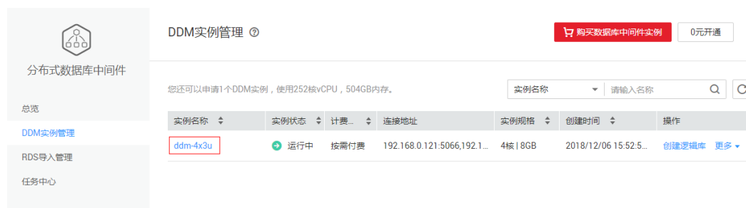
图 11-1 DDM 实例管理