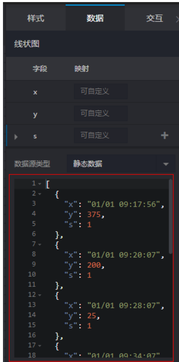
图 10-1 查看数据格式（示例）