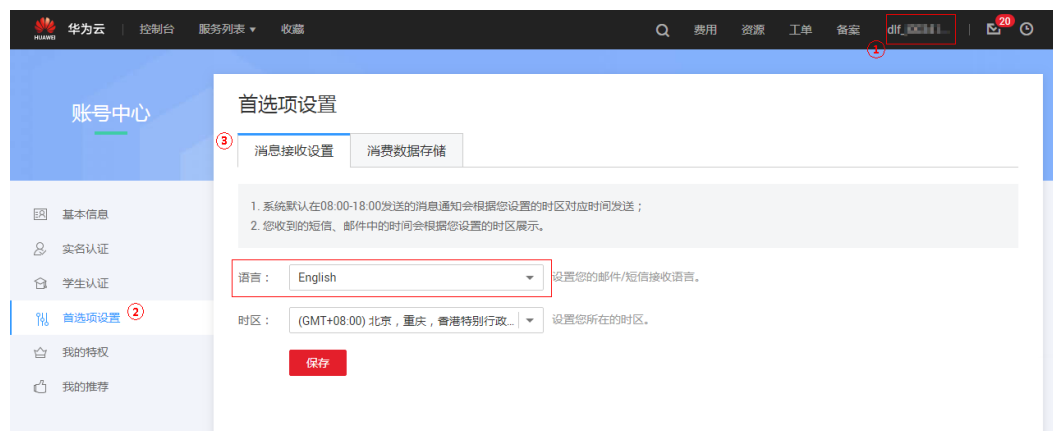
图 11-1 修改通知消息语言