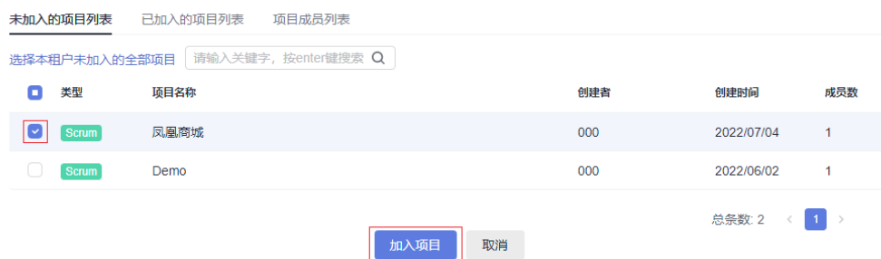
图 2-1 未加入的项目列表