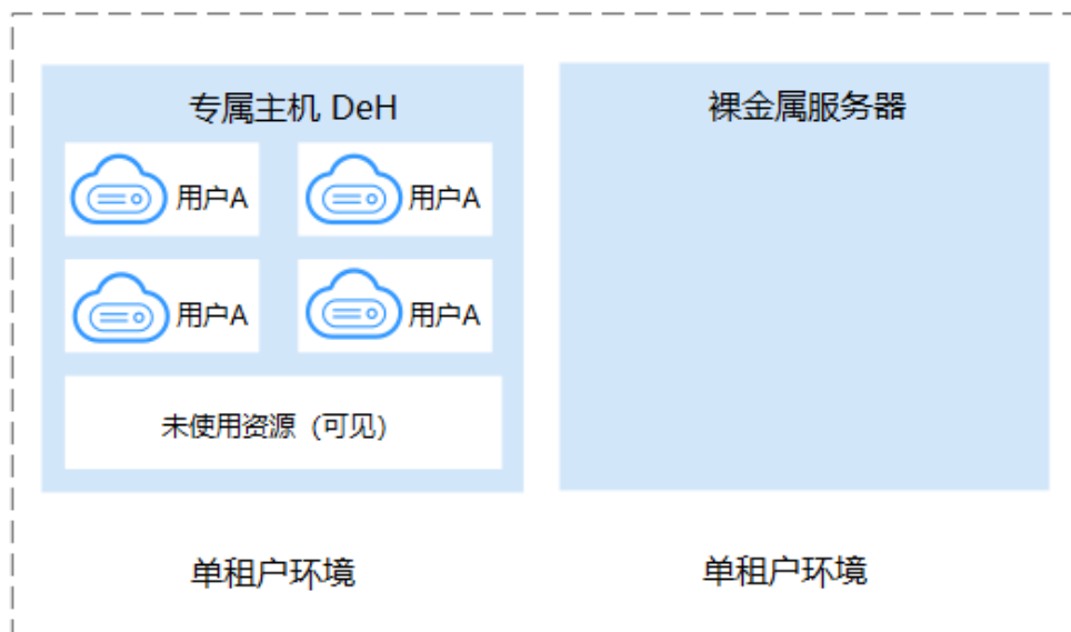
表 1-1 专属主机与裸金属服务器对比