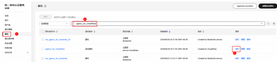
图 6-4 授权身份策略