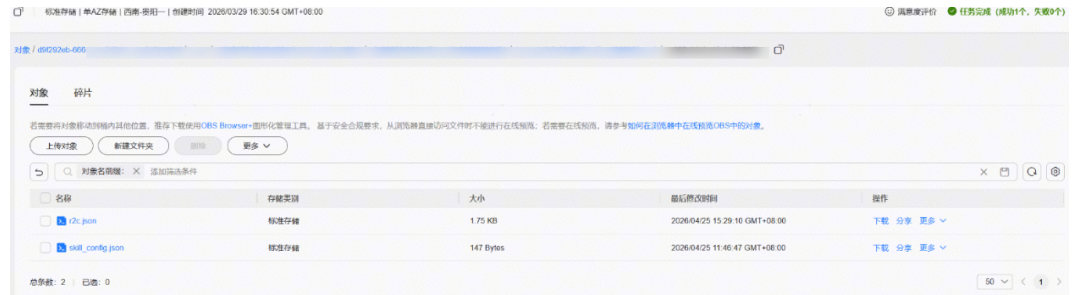
图 1-3 上传文件