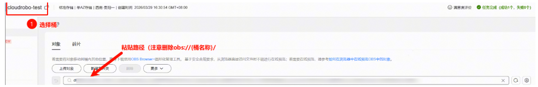
图 1-2 进入 OBS 存储模型路径