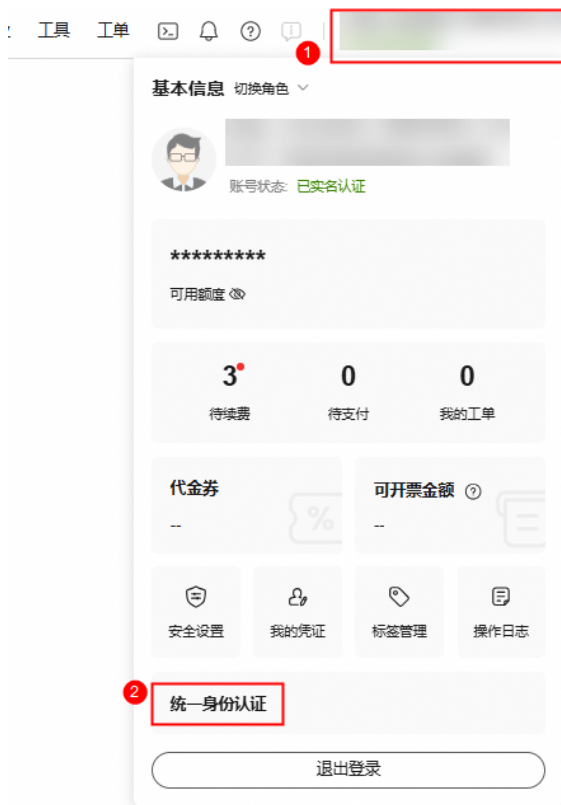
图 6-1 跳转统一身份认证平台