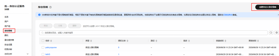
图 6-2 创建自定义身份策略