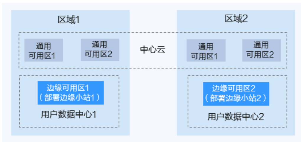
图 5-1 边缘小站与区域和可用区

在用户数据中心部署的边缘小站隶属于华为云区域的边缘可用区，该可用区基础设施由华为云完全托管、维护和支持，使用体验与通用可用区一致。边缘小站和其所属的边缘可用区为CloudPond用户专属，与其他公有云用户不共享，如图5-1所示。