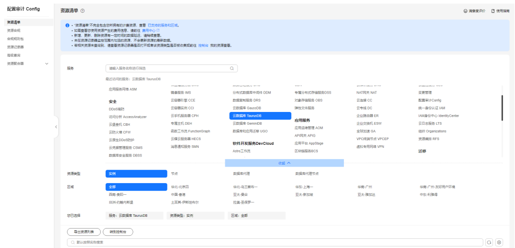
图 1-2 资源清单页面