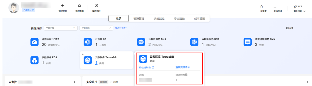
图 1-1 我的资源页面