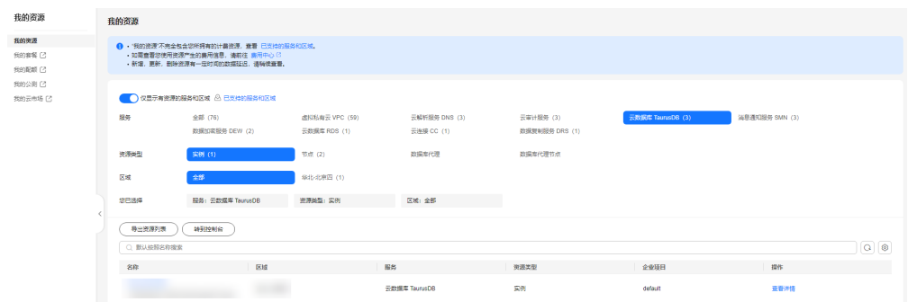
图 1-3 我的资源页面