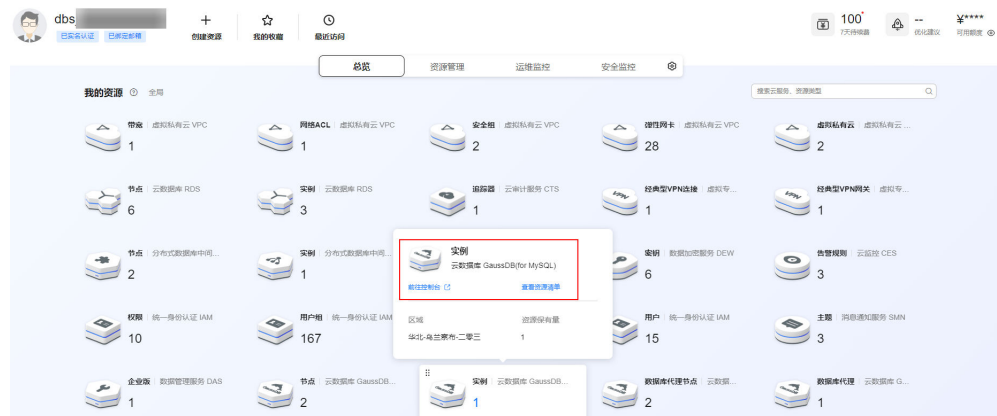
图 1-1 我的资源页面