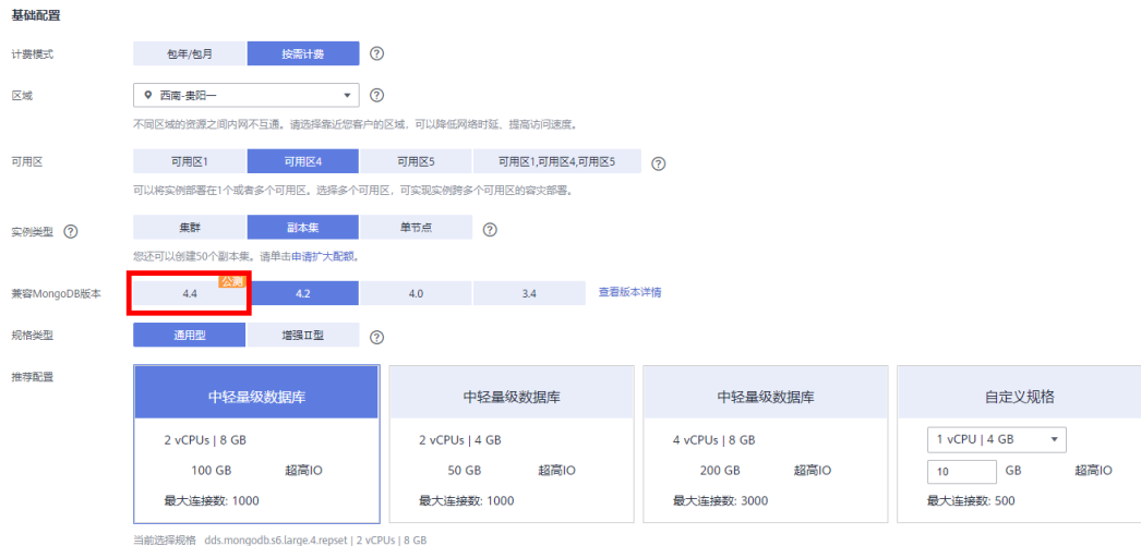
图 2-1 配置信息

步骤5 “区域”选择当前公测中的区域，购买页面“兼容MongoDB版本”选择“4.4”，其他配置项按需选择，参考 快速购买 和 自定义购买 。