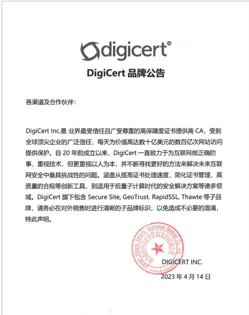
图 9-1 DigiCert 品牌公告