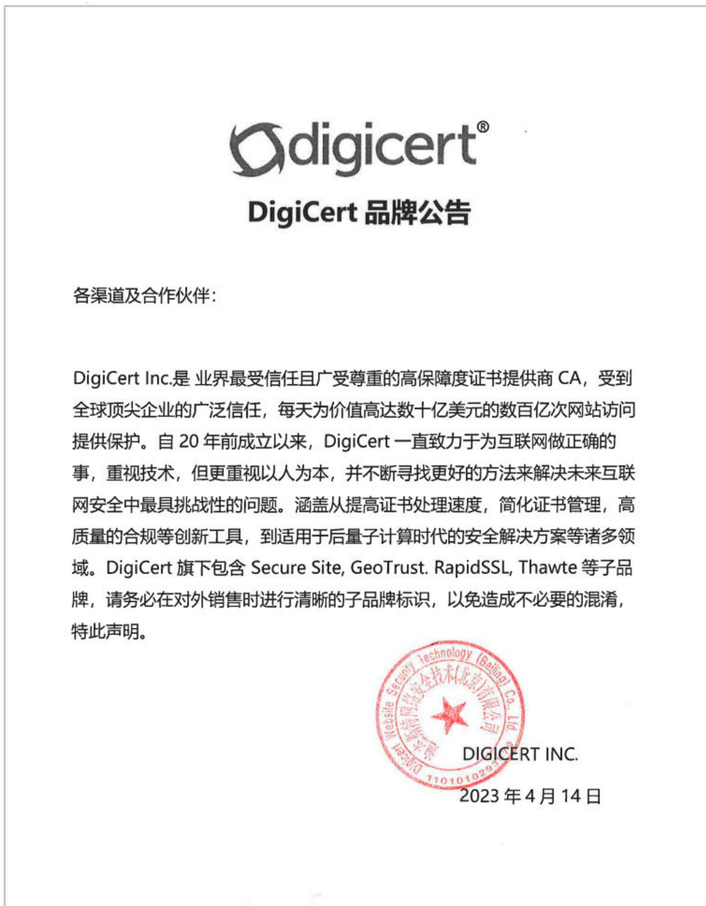
图 12-1 DigiCert 品牌公告