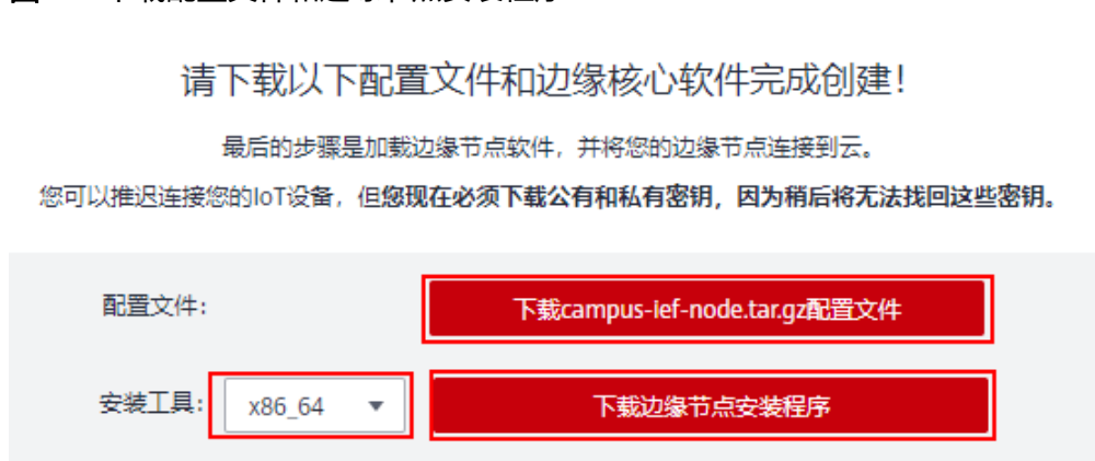
图 1-2 下载配置文件和边缘节点安装程序