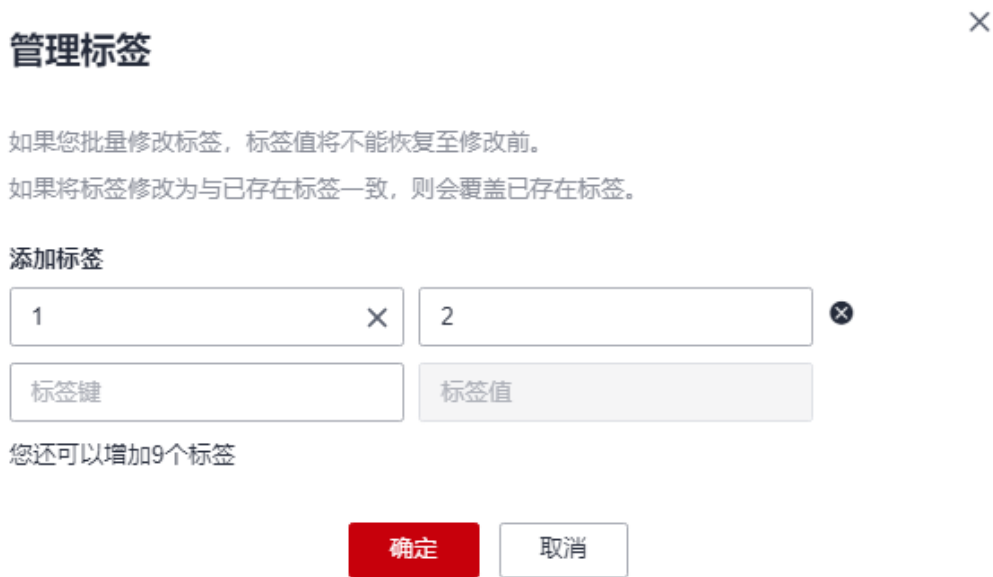
图 2-7 添加标签