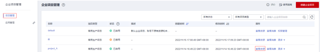
图 2-5 查看资源

步骤3 在企业项目管理页面，单击企业项目操作列的“查看资源”。系统进入企业项目详情页面，在“资源”页签下可查看该企业项目内资源信息。