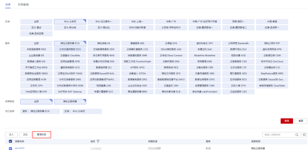
图 2-6 管理标签