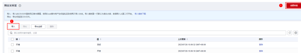
图 2-4 创建或导入预定义标签

现计划将一批ECS迁移至华为云上，需迁移完成后快速准确地为其添加如 按部门和规格为ECS添加标签 所示三种业务部门的标签加以区分，可通过以下两种途径实现：