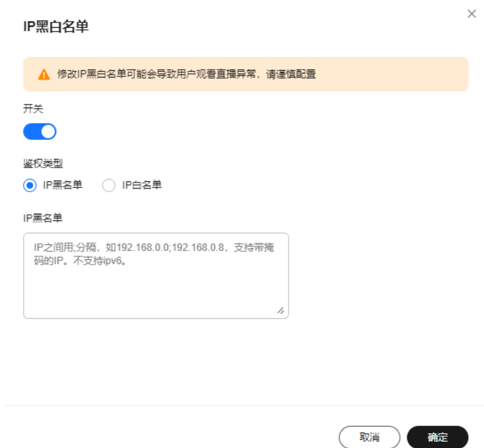
图 3-3 配置 IP 黑白名单