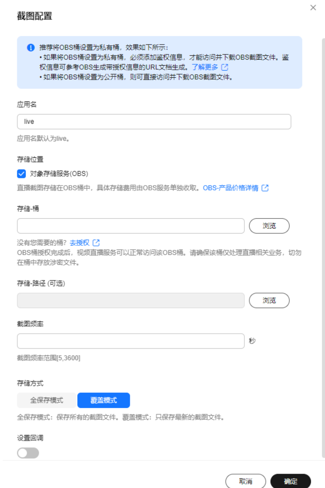
图 4-4 配置直播截图模板