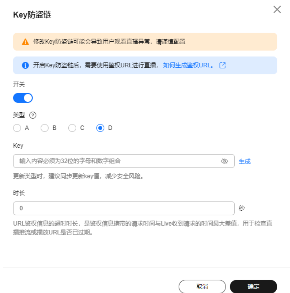
表 3-1 Key 防盗链参数说明