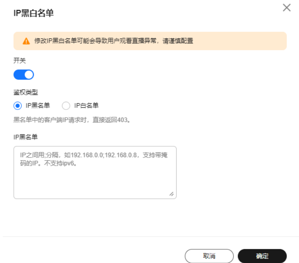
图 3-3 配置 IP 黑白名单