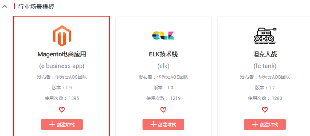
图 1-2 选择公共模板

在模板详情中，展示了该模板的概述，以及模板图示。magento应用组中包含了一个magento前台应用和MySQL数据库应用。且magento依赖于MySQL应用，需要将数据存储在MySQL中。