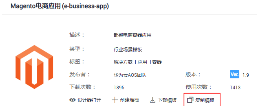
图 1-3 复制模板

步骤4 修改“模板名称”，本例为“my-business-app”，单击“确定”，系统跳转到“my-business-app”模板详情页面。