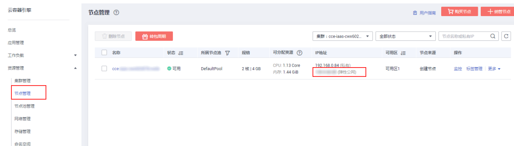
图 1-1 查看是否存在可用节点

您可登录 CCE控制台 ，单击“资源管理 > 节点管理”，查看到节点状态为“可用”，弹性IP已绑定。获取该弹性IP值。