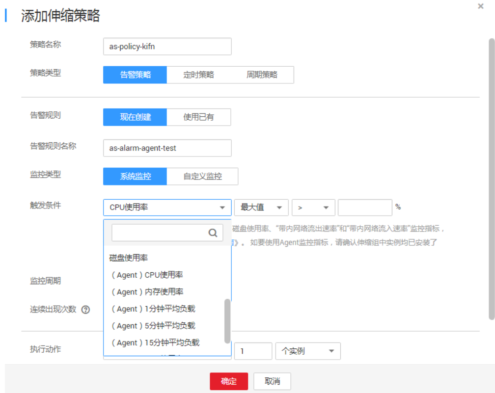
图 3-5 选择触发条件