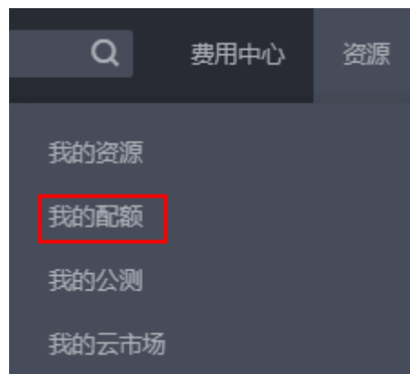
图 1-2 我的配额