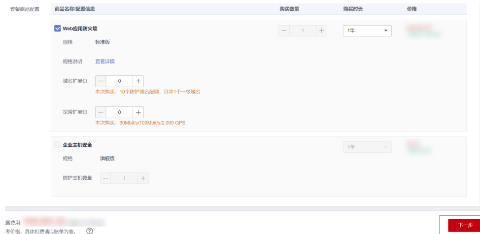
图 3-3 参数配置

步骤3 在套餐商品配置一栏中，企业主机安全 HSS、Web应用防火墙需要审视是否需要额外配置域名拓展包以及宽带拓展包。配置完成后，单击下一步。