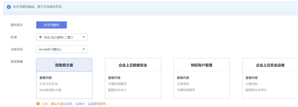
图 3-2 选择套餐

步骤3 在套餐商品配置一栏中，企业主机安全 HSS、Web应用防火墙需要审视是否需要额外配置域名拓展包以及宽带拓展包。配置完成后，单击下一步。