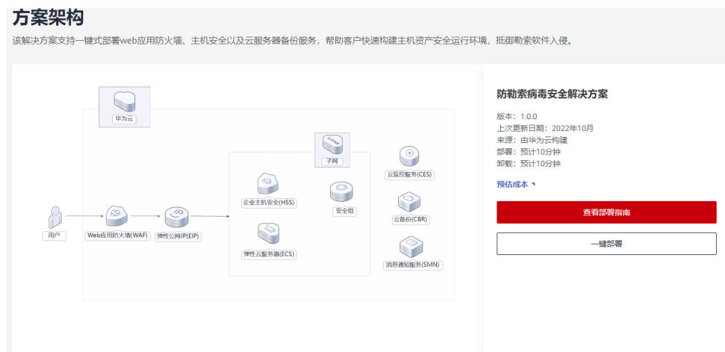
图 3-1 解决方案实施