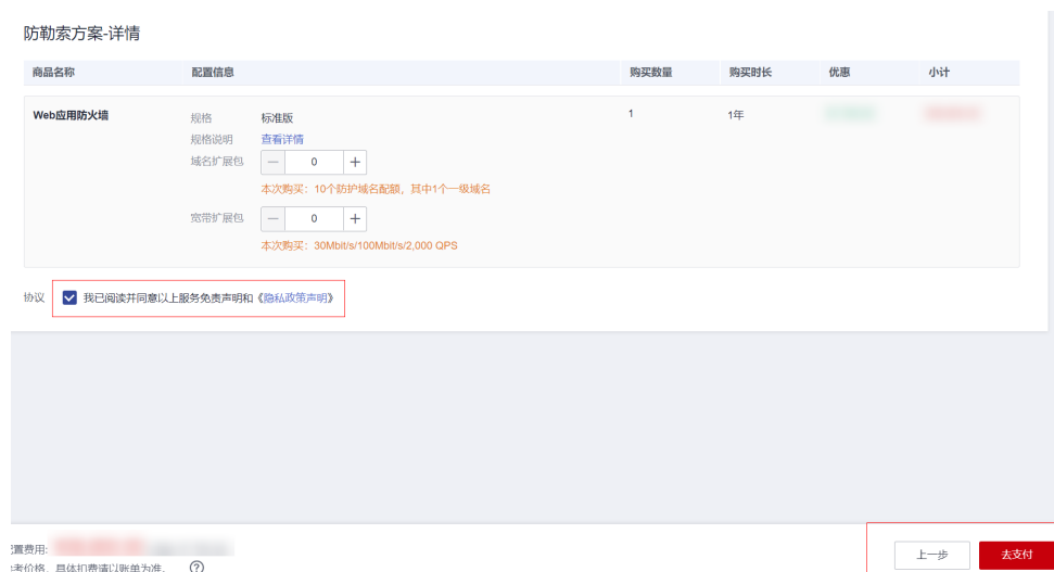
图 3-4 高级配置