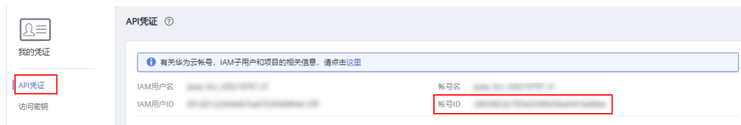
图 7-2 获取帐号 ID