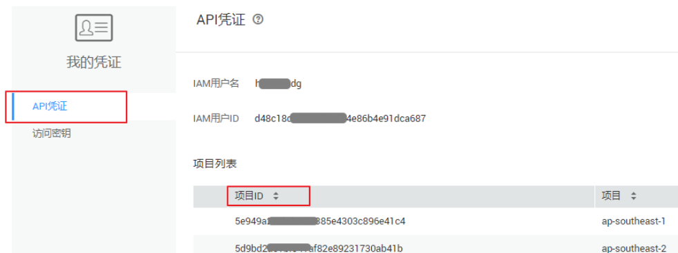
图 7-1 查看项目 ID