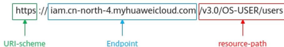
图 3-1 URI 示意图

https://iam.cn-north-4.myhuaweicloud.com/v3.0/OS-USER/users