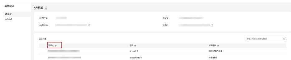
图 A-1 查看项目 ID