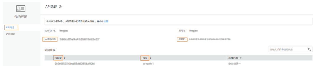
图 A-1 获取项目 ID