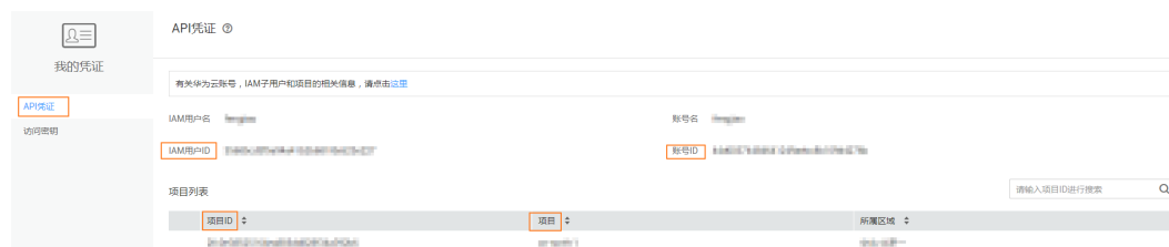
图 A-2 获取帐号 ID