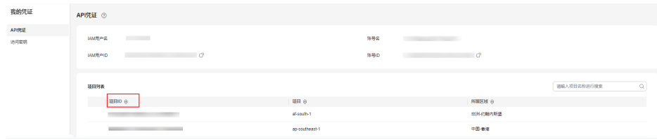
图 A-1 查看项目 ID