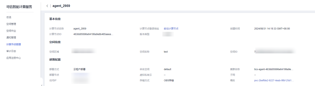
图 1-3 前往计算节点