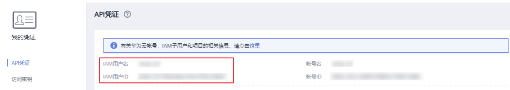
图 7-2 API 凭证