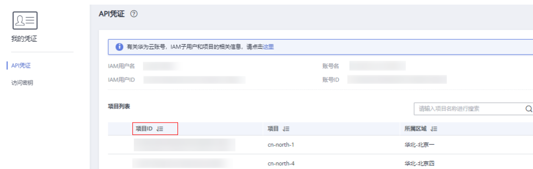
图 13-1 查看项目 ID