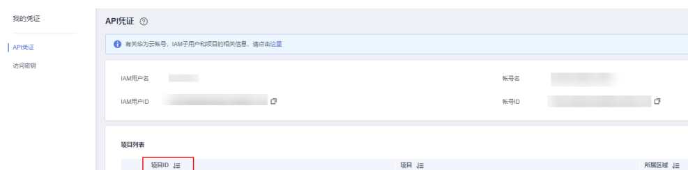
图 A-1 查看项目 ID