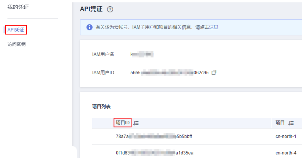
图 7-1 查看项目 ID