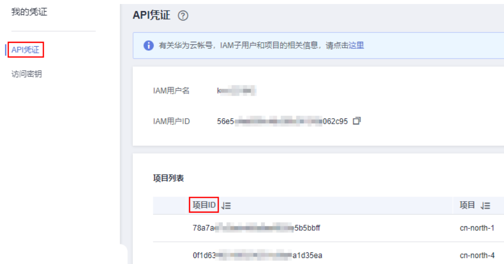
图 6-1 查看项目 ID