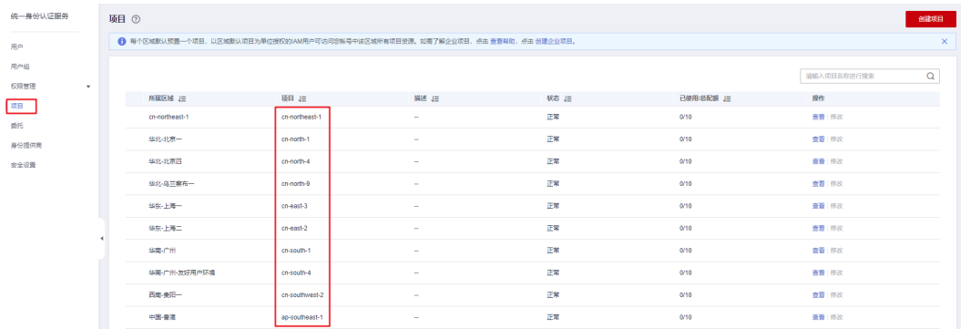
图 6-4 查看区域 ID