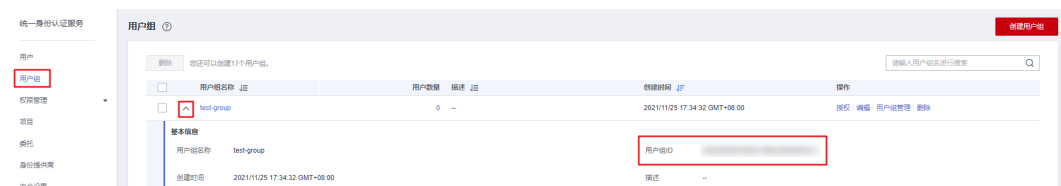
图 6-3 查询用户组名称、用户组 ID