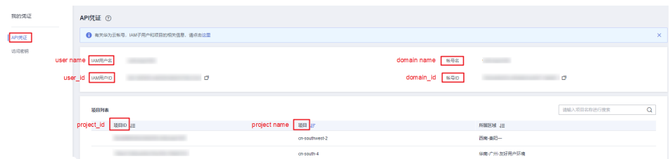
图 6-2 查看账号名、账号 ID、用户名、用户 ID、项目名称、项目 ID