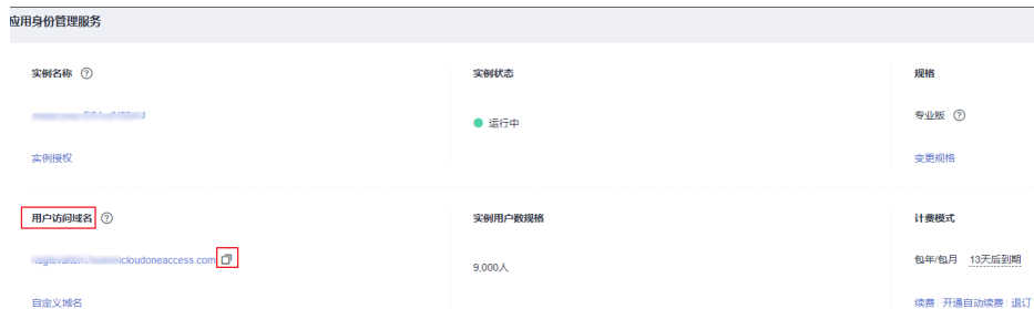
图 1-1 获取用户访问域名