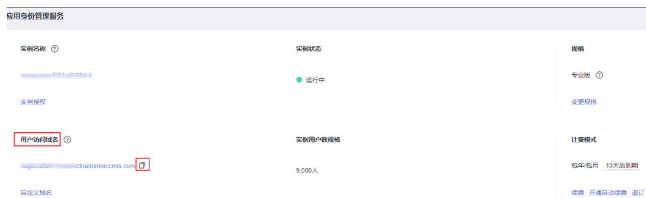
图 1-1 获取用户访问域名