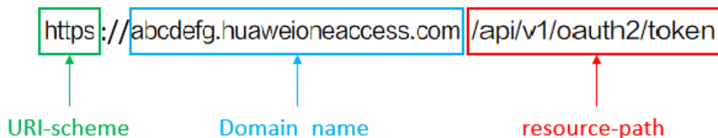
图 3-3 URI 示意图

https://abcdefg.huaweioneaccess.com/api/v1/oauth2/token