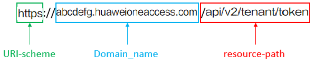
图 3-1 URI 示意图

https://abcdefg.huaweioneaccess.com/api/v2/tenant/token