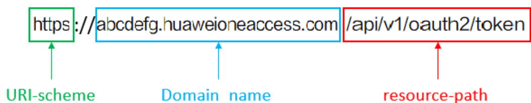
图 3-3 URI 示意图

https://abcdefg.huaweioneaccess.com/api/v1/oauth2/token