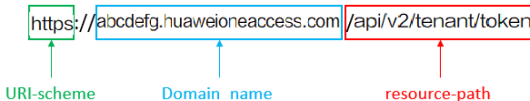
图 3-1 URI 示意图

https://abcdeffg.huaweioneaccess.com/api/v2/tenant/token