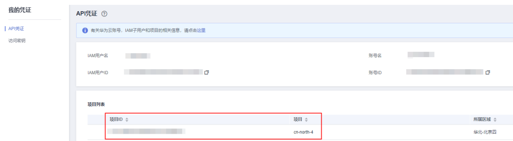
图 7-1 查看项目 ID