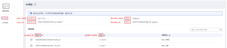
图 3-4 查看账号名、账号 ID、用户名、用户 ID、项目名称、项目 ID