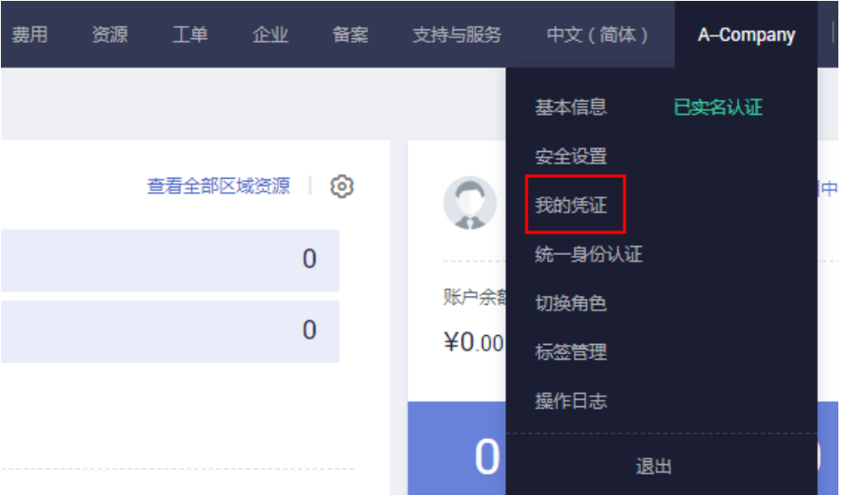
图 3-3 进入我的凭证