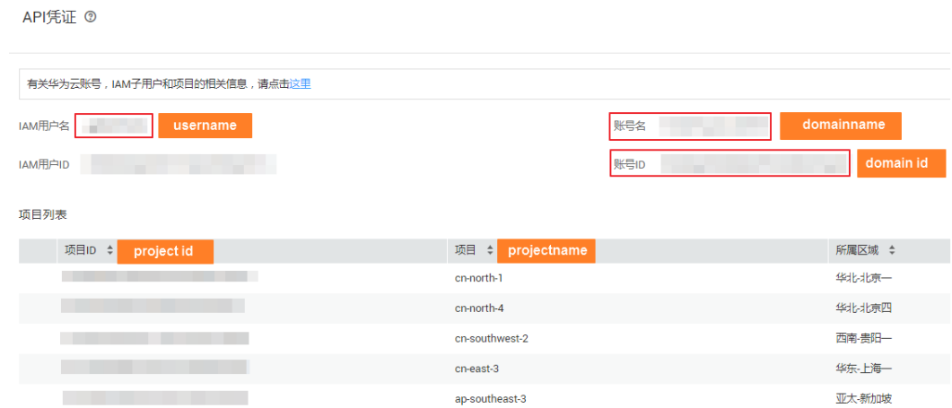
图 16-3 获取账号 ID