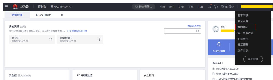
图 16-1 管理控制台