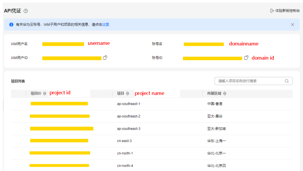
图 16-2 获取项目 ID