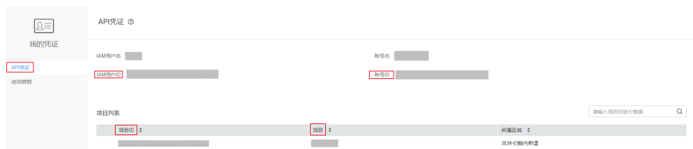
图 5-2 获取账号 ID