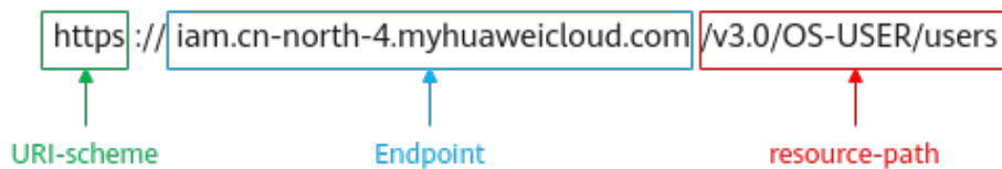
图 3-1 URI 示意图

https://iam.cn-north-4.myhuaweicloud.com/v3.0/OS-USER/users